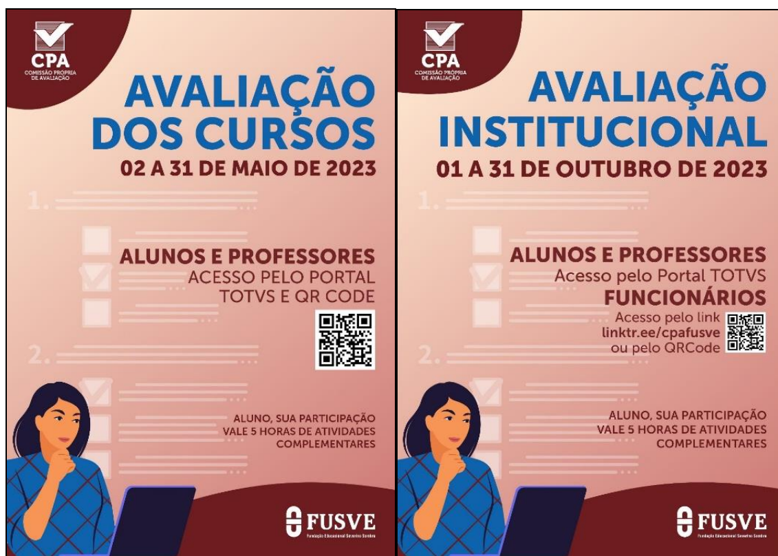
Figura 2. Avaliômetro da Avaliação Institucional

Divulgação semanal para os coordenadores e embaixadores da CPA sobre o percentual de avaliação