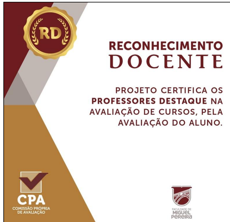
Figura 6. Material de divulgação Devolutiva CPA