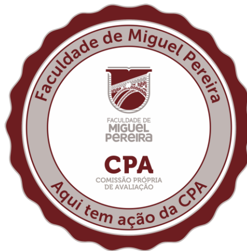
Figura 4. Material de divulgação projeto Embaixador da CPA