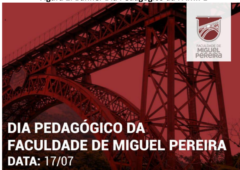
Figura 2. Banner Dia Pedagógico da FAMIPE